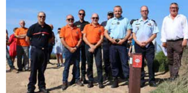
Présentation officielle sur le site du Grand-Mont, le jeudi 10 août, auprès des divers intervenants en matière de secours sur le territoire communal (pompiers, gendarmerie, police municipale et SNSM)

Consciente de cet enjeu de sécurité, la commune a donc mis en place cet été une série de 54 bornes numérotées sur le sentier côtier et au niveau des accès aux plages. Les pompiers disposent des coordonnées GPS de ces emplacements. Par simple indication du numéro mentionné sur une borne, ils peuvent ainsi géolocaliser avec précision l'appelant et intervenir rapidement auprès des victimes. La gendarmerie, la police municipale, la SNSM et le Cross d'Étel disposent également d'un plan de situation de ces bornes afin de faciliter leurs interventions. Une initiative saluée par le contrôleur général Jean-François Gouy, directeur départemental du Service départemental d'incendie et de secours du Morbihan (SDIS), lors de la présentation officielle le 10 août dernier au Grand-Mont.