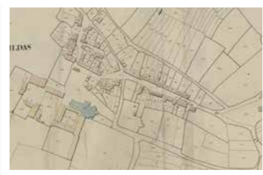
Cadastre napoléonien de 1827

S'appuyant sur l'opportunité offerte par la remise en état des réseaux souterrains d'eau potable et d'assainissement, dont la nécessité a été mise en évidence par une étude de GMVa, la commune a donc pris la décision d'engager une opération de requalification des espaces publics centraux. Celle-ci a été confiée à une équipe de maîtrise d'œuvre pluridisciplinaire : paysage-urbanisme (ArTOPIA), bureau d'études VRD (Legavre) et architecte du patrimoine (Guillemaut).