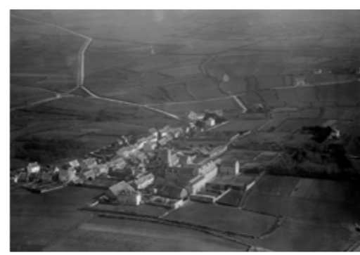
Le bourg en 1921