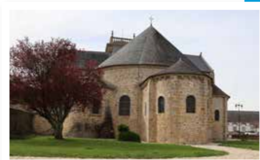
« L'Abbatiale est le point névralgique du bourg tant au niveau du patrimoine qu'en termes d'aménagements urbains. Les points de vue doivent être préservés et mis en scène » (source : diagnostic)