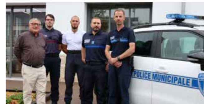
L'équipe en poste l'été dernier, auprès du maire

Considérées comme la troisième force de police en France, les polices municipales sont avant tout des polices de proximité qui tentent d'être le plus possible en contact avec la population. Elles gèrent au mieux les problèmes quotidiens de petite et moyenne délinquance et s'efforcent de garantir la sécurité des personnes et des biens.