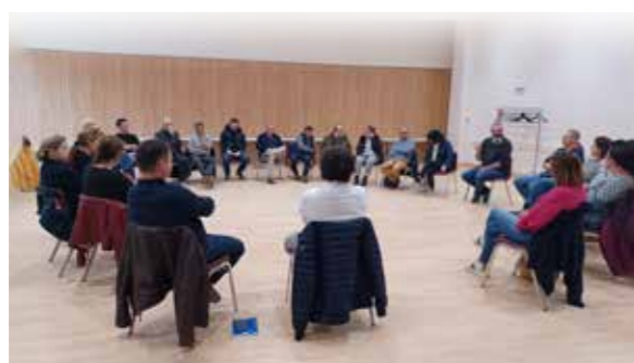
L'atelier du 20 novembre