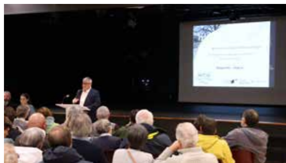
Présentation publique du diagnostic le 6 novembre

La commune mène depuis plusieurs années des aménagements urbains ou architecturaux pour susciter un développement équilibré et cohérent de ses espaces urbanisés. Différents projets ont déjà été menés pour conforter et valoriser le centre-bourg, assurer de la mixité sociale et immobilière ainsi que sécuriser les déplacements alternatifs.