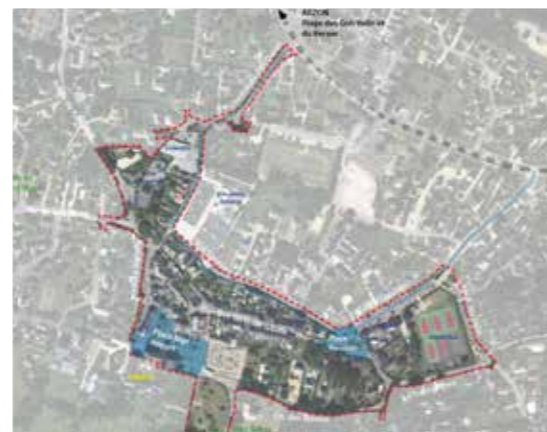
--- Périmètre de l'étude du Cœur de bourg