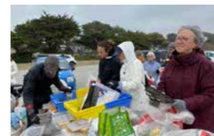
© Les Mains dans le sable