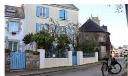
« Avant la construction de la RD 198, la route principale traversait le bourg par la rue du Général de Gaulle puis par la rue des Vénètes et la route de Kercaradec » (source : diagnostic)