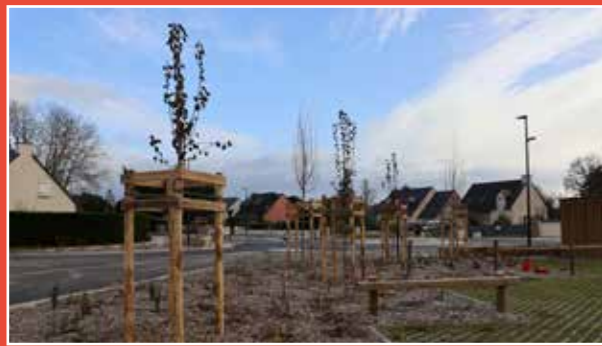
Entrée de bourg

Le réseau d'assainissement fera l'objet d'une réhabilitation au mois de mars 2024, sous maîtrise d'ouvrage de GMVA.