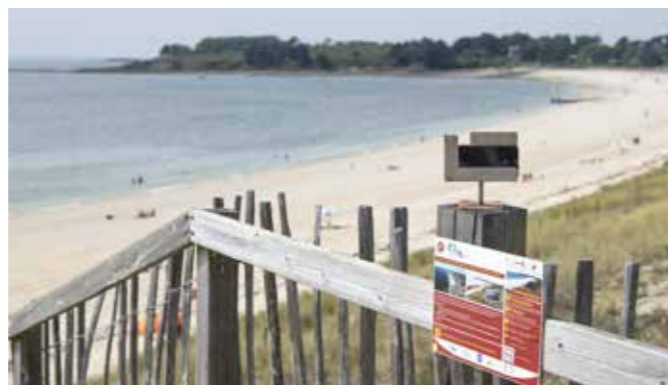
Plage du Fogo Kerjouanno Arzon

La dune du Rohu a été sélectionnée pour accueillir une station « coastsnap », qui devra voir le jour d'ici peu.